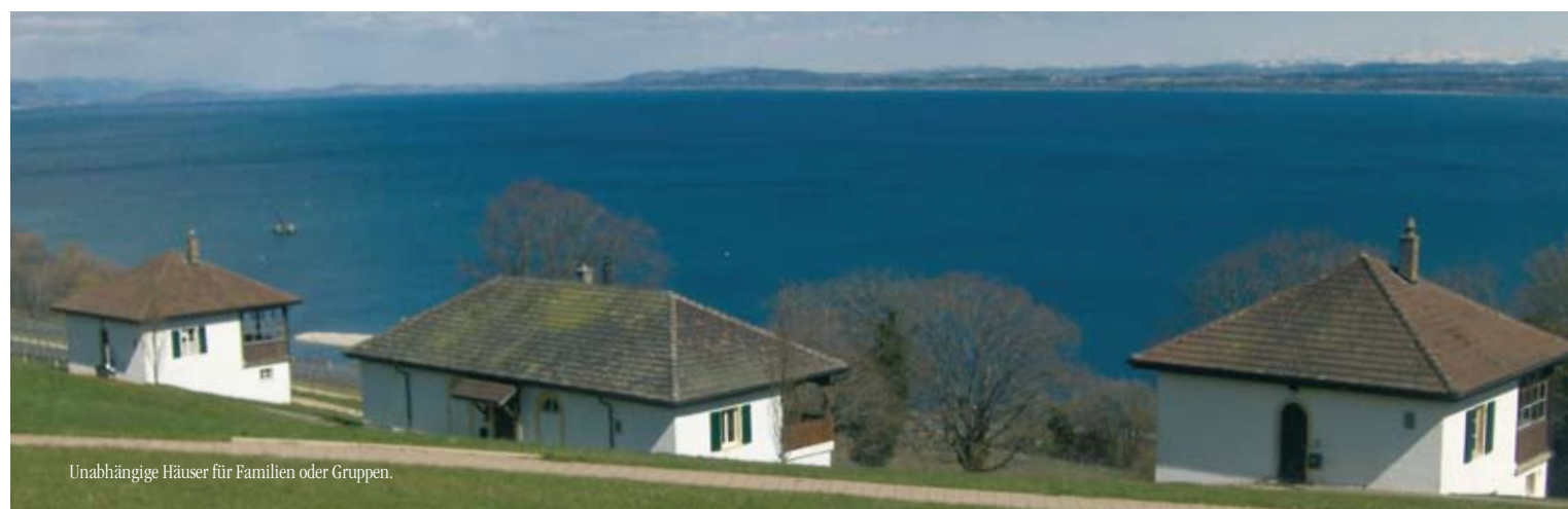
Unabhängige Häuser für Familien oder Gruppen.

Zahlreiche Sportanlagen in einer geeigneten Umgebung für Spiel, Sport und Freizeit ohne Grenzen.